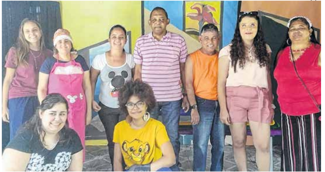
Peça “Uma Lição de Vida” será encenada pelo grupo teatral Nova Vida

Já na quinta-feira (3), será realizada a exibição da peça “Uma Lição de Vida”, encenada por atores com deficiência visual do grupo de teatro “Nova Vida”, composto por alunos e alunas do Lar Escola Santa Luzia para Cegos de Bauru (LESL). A apresentação será às 15h, no Auditório João Paulo, no Unisagrado.