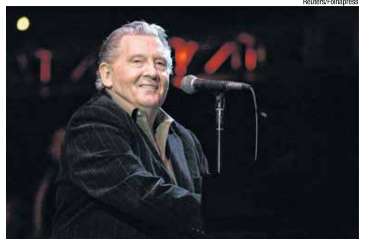
Jerry Lee Lewis ganhou quatro Grammys ao longo da carreira

Grammy Lifetime Achievement Award e dois Grammy Hall of Fame Awards.