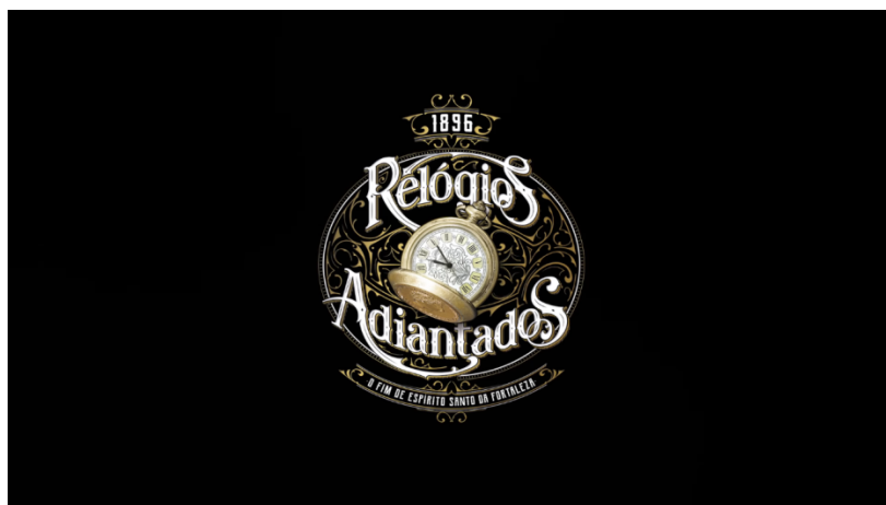
Aplicação da quarta atividade foi utilizada o vídeo: Relógios Adiantados – 19/11