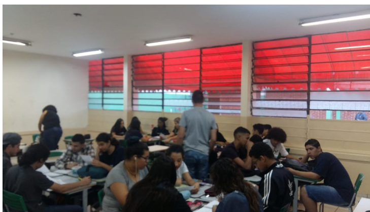
Aplicação da terceira atividade com a análise das fontes locais (Jornal da Cidade) – 12/11