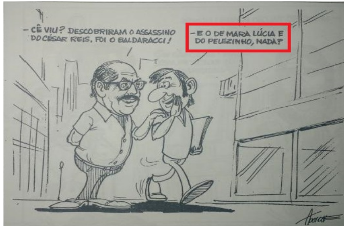
Figura 4– Personagens discutindo a “descoberta do assassino” na novela Pai Herói de 1979*