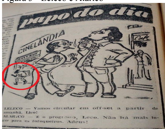
Figura 3 - Leleco e Alarico