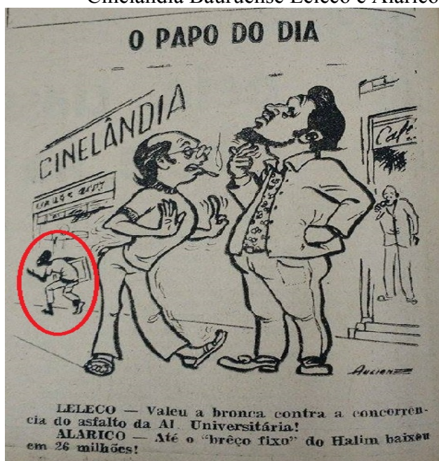
Figura 2- Charge “inaugural” dos personagens da Cinelândia Bauruense Leleco e Alarico