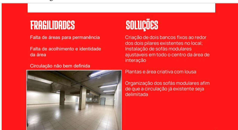
Figura 9: Área trabalhada 5 / Problemática

Partido: Disposição de mobiliário adequados afim solucionar as necessidades já existentes na área; criação de área criativa com lousa e canetas e áreas de descanso e permanência para o estudante.