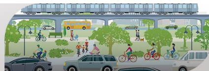
Figura 6: Croqui/ Vista da Proposta