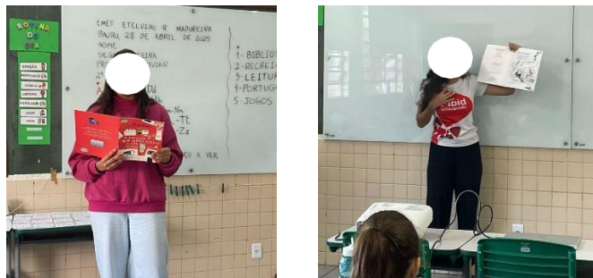
Figuras 1 e 2. Bolsistas realizando leitura em sala