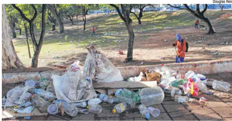
Após a festança, Parque Vitória Régia ficou com mais de 2 toneladas de lixo

De acordo com a Polícia Militar, passaram pelo evento cerca de 40 mil foliões. Muitos deles estavam fantasiados. Mas, além de diversão, houve tumulto e confronto com a PM, que usou gás de pimenta em alguns momentos. O evento só foi parcialmente dispersado após o início da chuva forte.