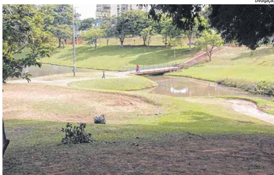
Força-tarefa de 40 profissionais durou três horas para deixar o local limpo